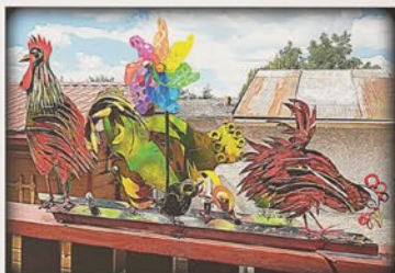
Né poslední zob

Humorista si môže byť istý, že keď si z niekoho strieľa a trafi sa, dopady budú len na neho (toto rozprávam všade zasa ja).